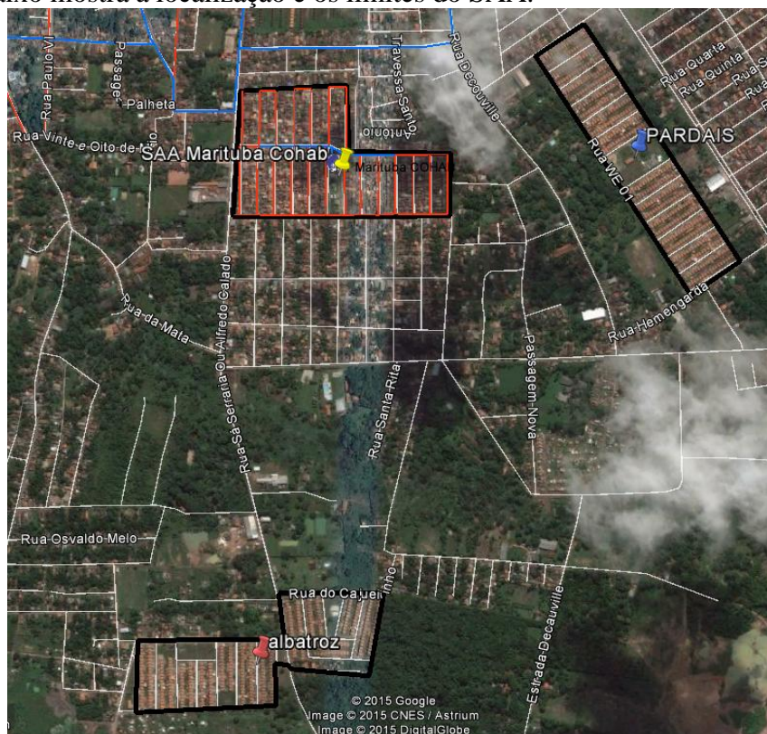
Figura 3: Limites da área abastecida pelo sistema Marituba COHAB.

A figura 3 abaixo mostra a localização e os limites do SAA.