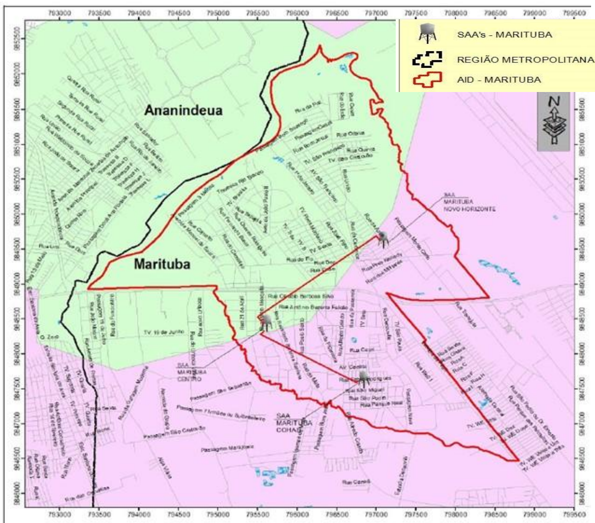
Figura 1: SAA's existentes na AID dos projetos a serem elaborados.