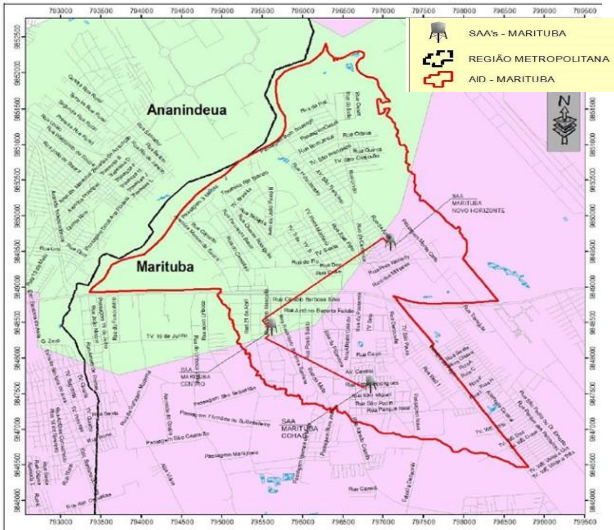
Figura 1: SAA's existentes na AID dos projetos a serem elaborados.

A figura a seguir apresenta os sistemas envolvidos nos projetos a serem elaborados a partir desta Especificação Técnica, estando localizados na Área de Influência Direta -AID delimitada a seguir: